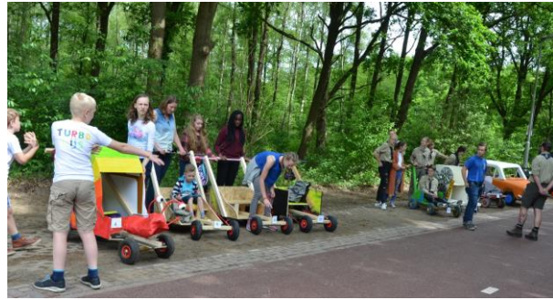
Bolides in pole-position, zeepkistenrace, mei 2017, Celebeslaan

De zeepkistenrace: Op 't Hofke (noord) wordt een parcours met hindernissen uitgezet. Je bouwt je eigen zeepkist en komt daarmee racen. Wie is de snelste? Wie bouwt de mooiste zeepkist? We zullen het zien op 30 oktober . De middag begint om 12.00 uur met een technische keuring van de zeepkisten. Je karretje moet natuurlijk wel veilig zijn, we willen geen crashes. Daarna gaan we van start. Het thema is: GROEN MOET JE DOEN.